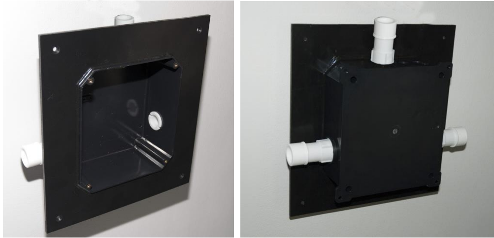
Exempelbild: antal anslutningar och placering är ej korrekt